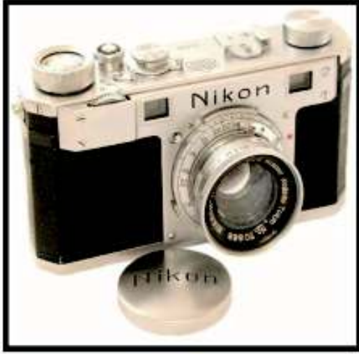
নাইকন-১, ১৯১৭ সালে জাপানের নিগন কোজাকু কে কে কোম্পানি বাজারজাতকৃত প্রথম নিকন ক্যামেরা। পরবর্তীতে এই নিগন কোম্পানি নাইকন-এ রূপান্তরিত হয়।