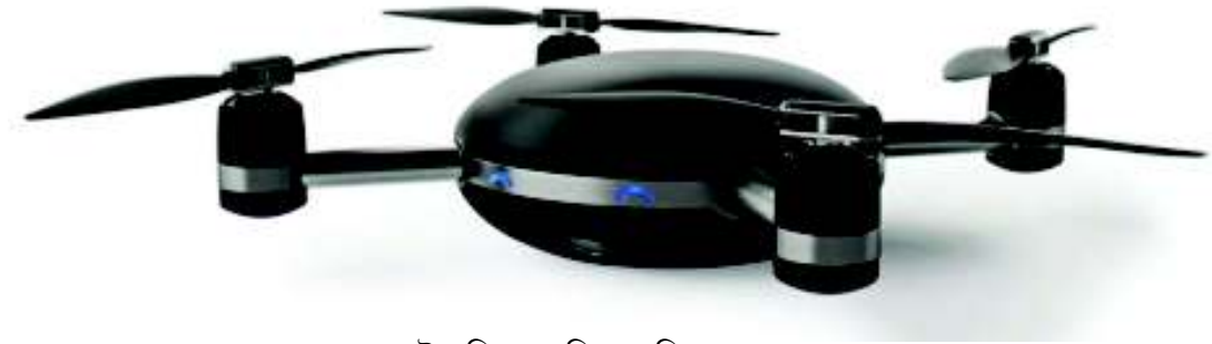
ফটোগ্রাফির আধুনিক প্রযুক্তি ড্রোন ক্যামেরা