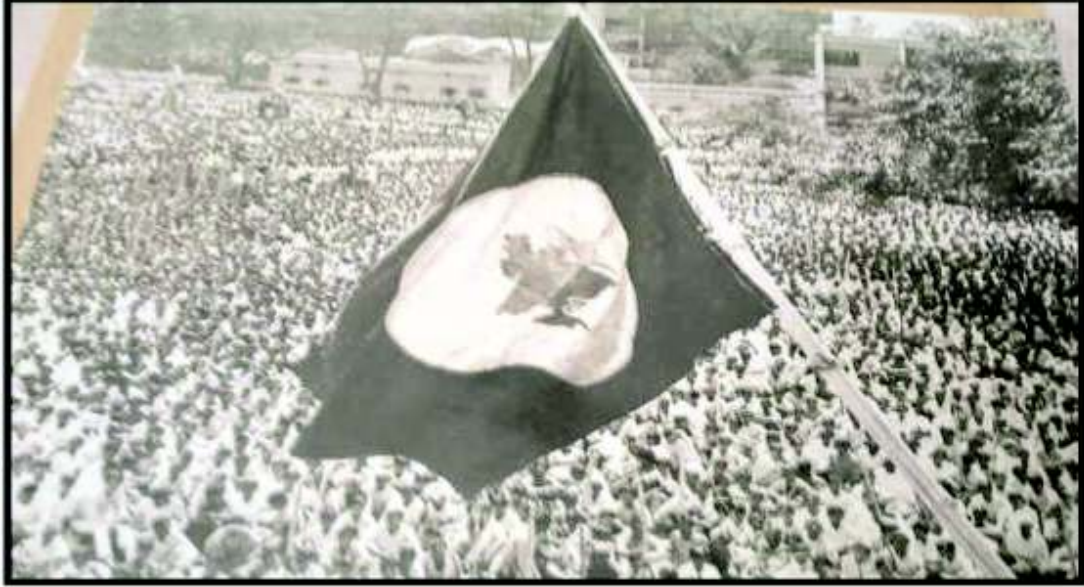
২রা মার্চ ১৯৭১ ঢাকা বিশ্ববিদ্যালয়ের শিক্ষার্থীরা স্বাধীন বাংলার পতাকা উত্তোলন করার ছবি : জালালউদ্দিন হায়দার (সূত্র : হোসেন, ২০১৫)

বাংলাদেশে ফটোসাংবাদিকতা এখন অনেক দূর এগিয়ে গেছে। বিশেষ করে প্রযুক্তির ব্যবহারে এখন খুব একটা পিছিয়ে নেই। কিন্তু সে ক্ষেত্রে আলোকচিত্রের মান যে অনেক উন্নত হয়েছে তা বলা যাবে না। আমরা জানি, দৈনিক বাংলায় একপর্যায়ে ২ জন আলোকচিত্রীর জন্য প্রায় ৬-৭ মাস একটা ক্যামেরা বরাদ্দ ছিল (হোসেন, ২০১৫)। সে সময় ক্যামেরার দাম PENTAX K-1000 সম্ভবত ৬-৭ হাজার টাকা ছিল। আর যায়যায়দিন পত্রিকা যা দৈনিক হিসেবে বেরোবার আগেই সেই পত্রিকার চার আলোকচিত্রীর জন্য ৫০ লাখ টাকা ৪ সেট লেটেস্ট ডিজিটাল ক্যামেরা কেনা হয়েছিল। সম্প্রতি প্রকাশিত একটি পত্রিকার জন্য কেনা হয়েছে ৯ লাখ টাকা দামের ডিজিটাল ক্যামেরা (হোসেন, ২০১৫)।