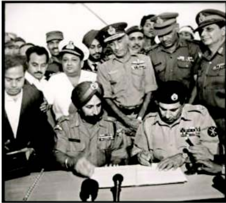
১৬ ডিসেম্বর রেসকোর্স ময়দানে নিয়াজীর আত্মসমর্পণের দলিলে স্বাক্ষর