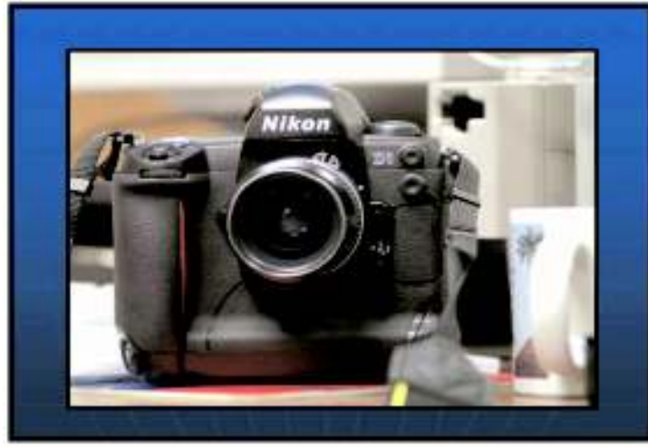
নাইকন ডিএসএলআর ডি-১ ক্যামেরা