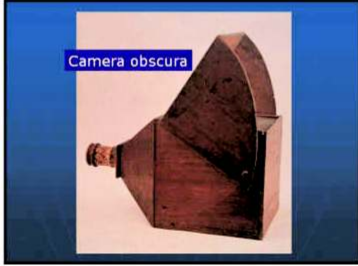
প্রায় ১৮৫ বছর আগেকার ক্যামেরা অবসকিউরা