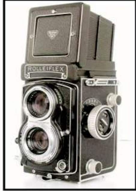
একটা সময় ফটো সাংবাদিকদের সবচেয়ে প্রিয় ছিল রলিফ্লেক্স টুইনলেঙ্গ এই ক্যামেরা