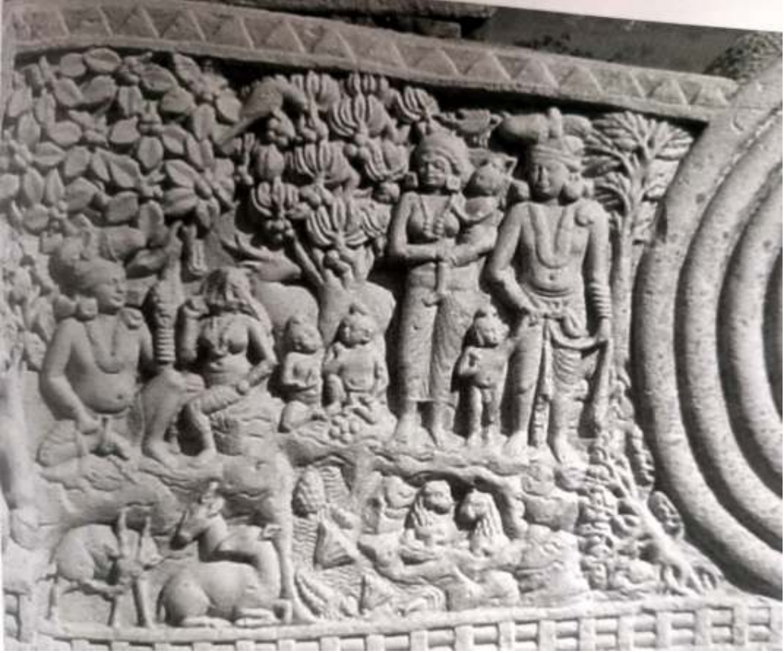
সাঁচীর তোরণে বিশ্বস্তর জাতক অবলম্বনে নির্মিত ভাস্কর্য।